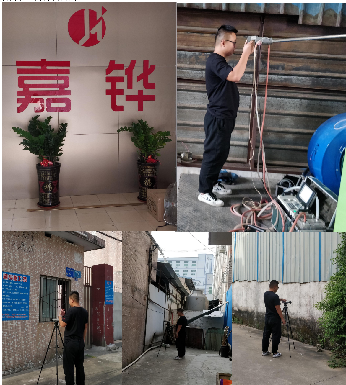
附件 3 采样照片