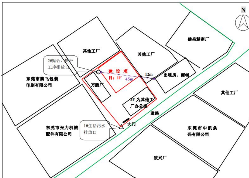
图 3-1 厂区平面布置及监测点位