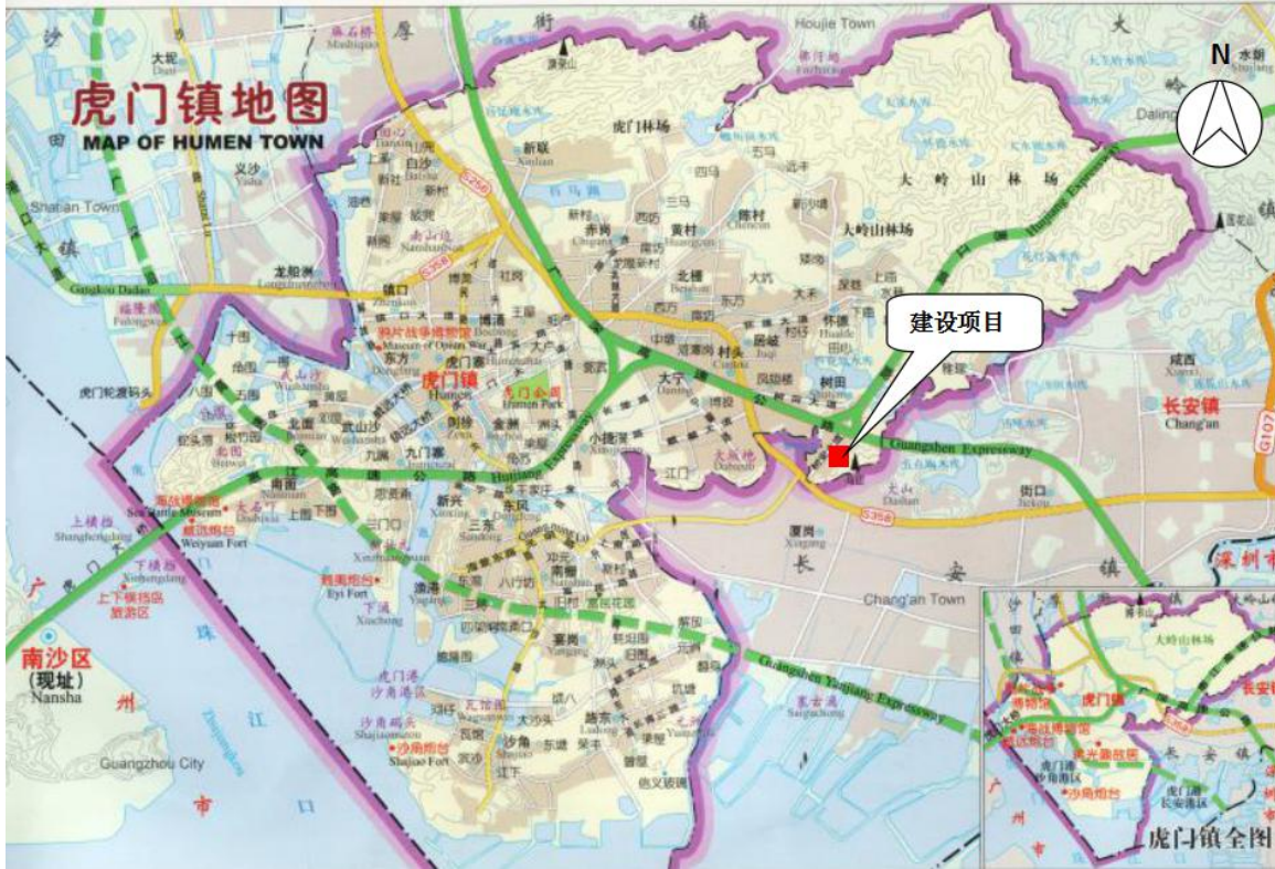
图 3-1 厂区地理位置

东莞市贝斯特热流道科技有限公司位于东莞市虎门镇树田社区裕田南路 7 号，地理位置见图 3-1，厂区平面布置及监测点位图见图 3-2。