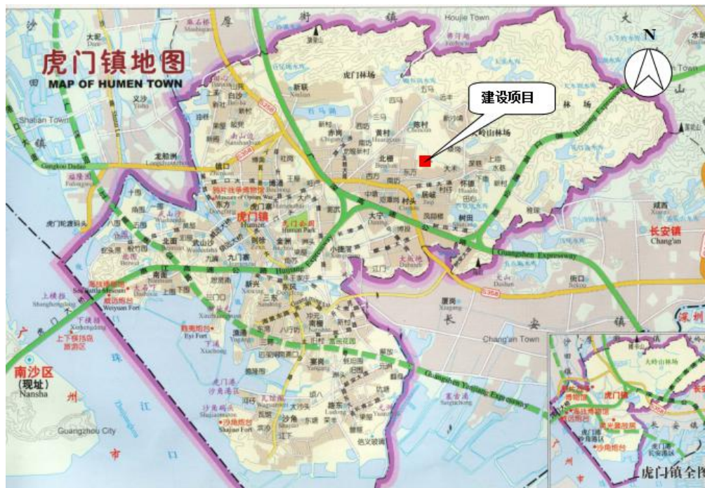
图 3-1 厂区地理位置图

东莞市规园实业有限公司位于东莞市虎门镇怀德大坑村沙场（地理坐标： N22^{\circ}50'31.93'' ， E113^{\circ}43'32.65'' ），地理位置见图 3-1，厂区平面布置及监测点位图见图 3-2。